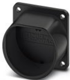
Halterung für Fahrzeug-Ladestecker als Parkposition an Ladestationen (EVSE), Typ 2, IEC 62196-2

Bitte beachten Sie, dass die hier angegebenen Daten dem Online-Katalog entnommen sind. Die vollständigen Informationen und Daten entnehmen Sie bitte der Anwenderdokumentation. Es gelten die Allgemeinen Nutzungsbedingungen für Internet-Downloads. ( http://phoenixcontact.de/download )