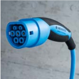
Ladekupplung Typ 2 für Mode 3 Ladung bis 22 kW Ladeleistung Ladekabel 5 m lang

Jede AMTRON® Wallbox verfügt über eine Ladesteckdose Typ 2 oder über ein fest angeschlossenes Ladekabel mit einer Ladekupplung Typ 2 oder einer Ladekupplung Typ 1.