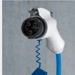
Ladekupplung Typ 1 für Mode 3 Ladung bis 3,7 kW Ladeleistung Ladekabel 5 m lang