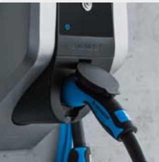
Ladesteckdose Typ 2 für Mode 3 Ladung bis 11 kW Ladeleistung mit Klappdeckel und Entriegelungsfunktion für den Ladestecker bei Stromausfall